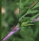
Tige velue et rougeâtre