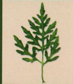
Feuille profondement découpée