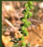
Flleurs mâles sur de longs épis